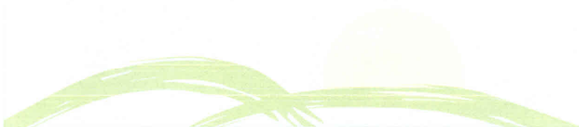
Mavíael Francisco de Moraes Cavalcanti Filho - Prefeito Municipal -